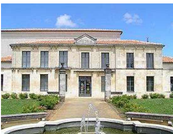
Rathaus von Cherves-Richemont in der Charente bei Cognac